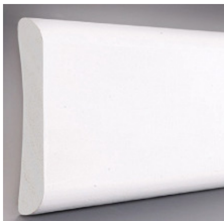
Figura 3: Guarnição (Alizar).