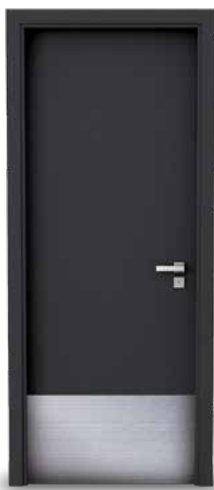
Porta com chapa de inox